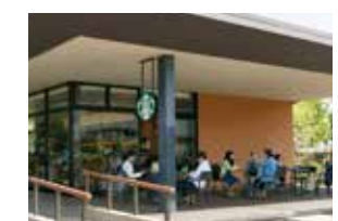
⑧スターバックス 言わずと知れたコーヒーショップ。講義の合間などにほっと一息。