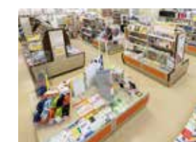
⑦丸善 食料品や文房具・書籍などがそろっています。