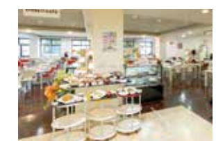
⑥クロスカフェ 附属病院内の食堂です。栄養バランスが考えられた食事が揃っています！