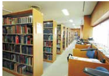
⑨附属図書館医学分館 医学部キャンパスにも図書館があります。