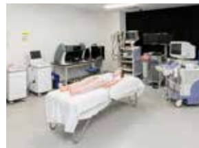
④融合研究臨床応用推進センター 建物内にシミュレーションセンターがあり、シミュレータ機器によりロボット手術や各種検査などの訓練ができます。