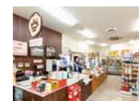
⑤ローソン 附属病院内ローソンがあり、誰でも利用できます。

臨床講義棟1階玄関には、大村博士が発見した物質「エパーメクチン」の分子構造を基にデザインされた記念モニュメント“Forever and ever”が設置されています。また、モニュメントの隣には、大村博士のプロブズ製の肖像レリーフが設置されています。